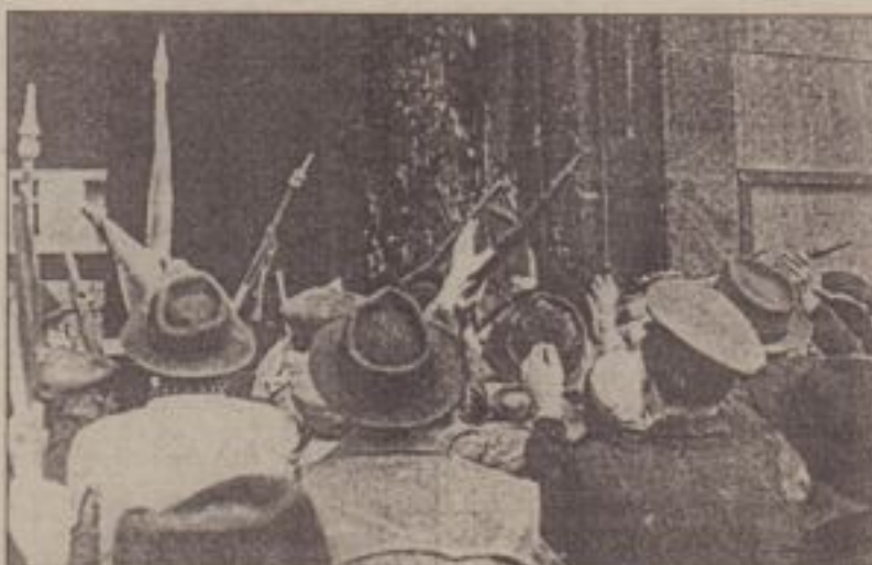
Cartierul general al poliției secrete este luat cu asalt

Presă comunistă devenise mai puțin virulentă, atacurile contra Occidentului făcându-se mai subtile dacă nu mai convingătoare. Dacă nimeni nu lua ad literam afirmațiile campaniei de "destalinizare", exista totuși o speranță de "liberalizare" bazată pe credința în concesii pe care "rușii au fost obligați să le facă", speranță întreținută de posturile de radio Londra, Vocea Americii, Paris și Europa Liberă. Credința fermă pe care aceste posturi o întrețineau - și anume că puterile occidentale "așteptau doar scânteia unei revolte" pentru a ne salva de ruși - lăsa o foarte mică șansă scepticismului lucid pe care-l propovăduiau adevărații cunoscători ai mentalității apusene.