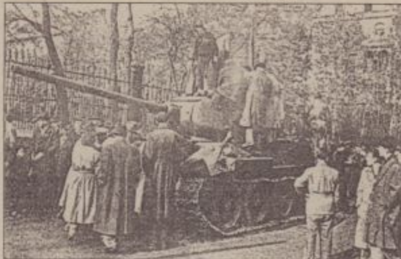
Studenți și muncitori au capturat un tanc sovietic

Concomitent, "fostul călău" Tito primea vizita spășiiților diurni ai Kremlinului - maresalul Bulganin și Nikita Hrușciov, doritori să reia "vechea prietenie".