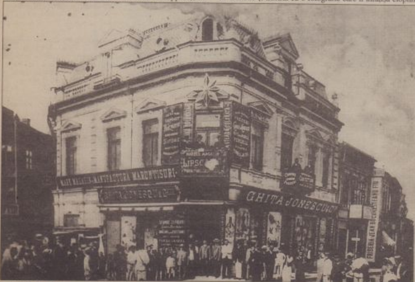
Prăvălia "La steaua colorată" din Craiova, deasupra căreia a locuit Brâncuși în 1902. Astăzi dărămată.