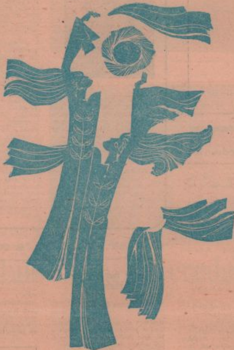
Desen de Eustațiu Gregorian

Printre copacii acestui peisaj sădesc cuvinte precum copacul, vaca și soarele amiezii. Acesta din urmă vă încălzește inima seamănă cu un poem pe care îl păstrez cu grijă ca pe-o amintire pentru mai tîrziu, pentru mult mai tîrziu.