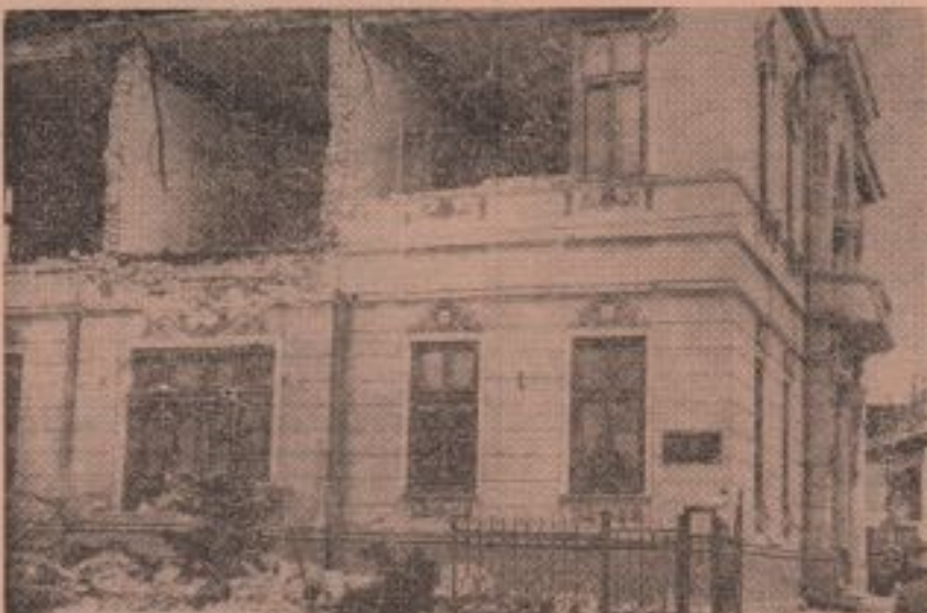
Jos: Casa Armatei, 5 martie 1977.