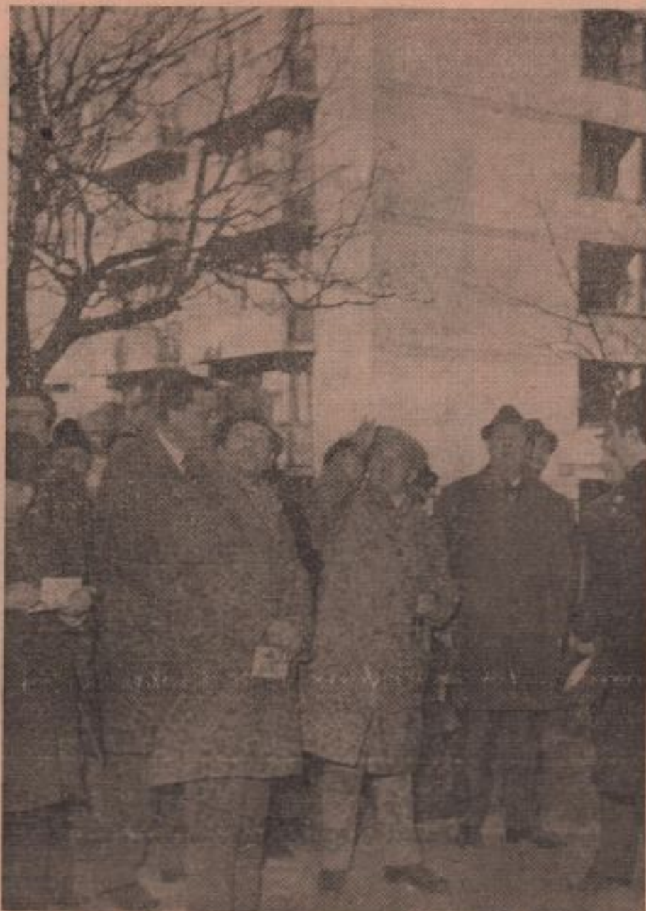
Prezent și la Craiova, tovarășul Nicolae Ceaușescu a dat indicații de o excepțională valoare pentru înlăturarea efectelor cutremurului.