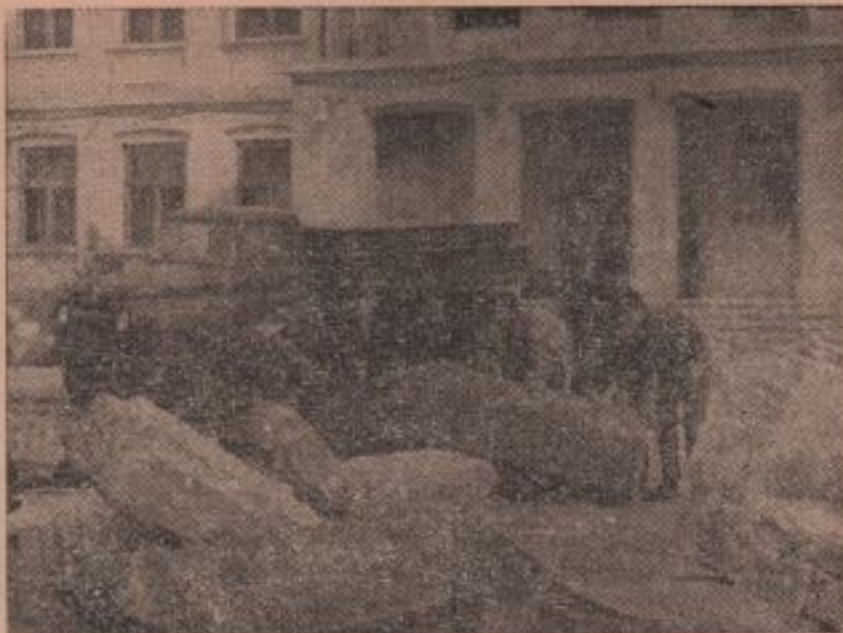
Sus: S-a lucrat în condiții dramatice...