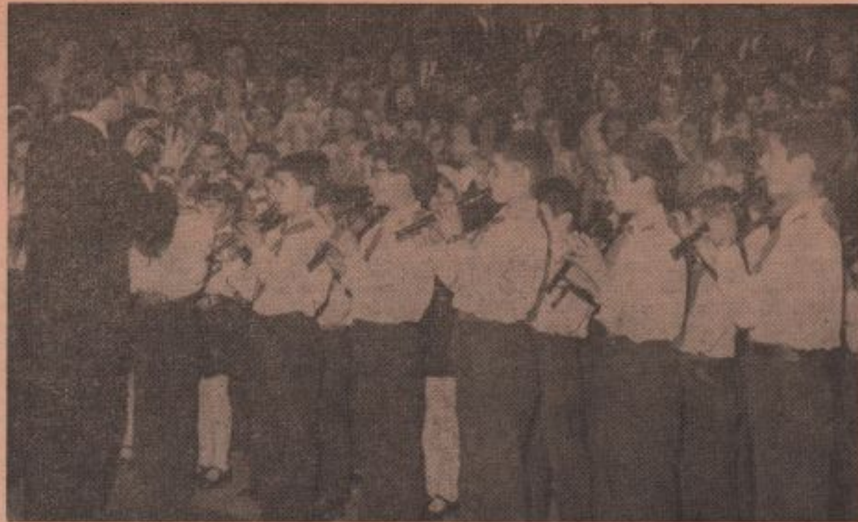
Moment din reușta manifestare de la Poiana Mare.

Înainte de a începe programul manifestărilor cultural-artistice, în sălile căminului cultural au fost vernisate trei expoziții de carte și documente: „Independența — suma vieții noastre istorice”, organizată de Biblioteca centrală