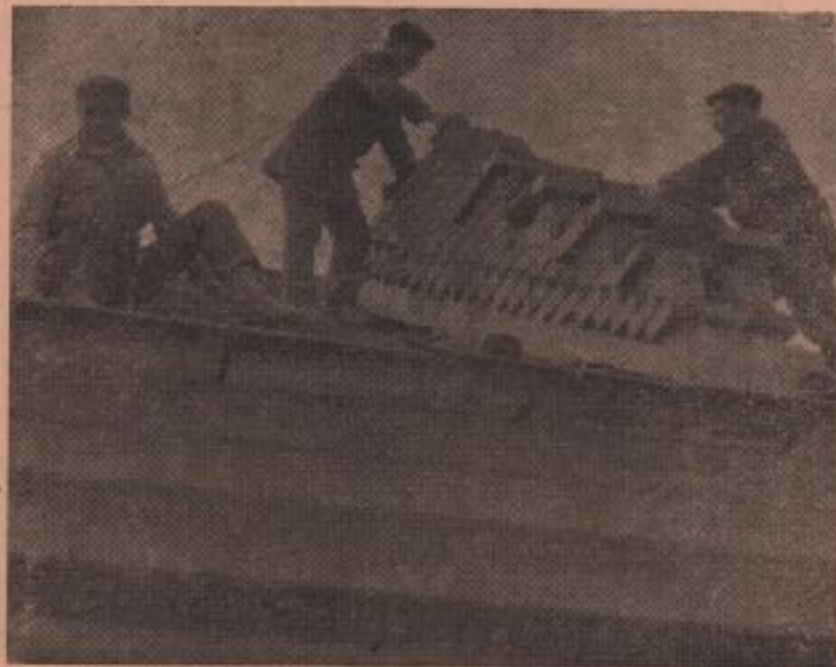
Eforturi sportive pentru înlăturarea urmărilor dezastrelor.