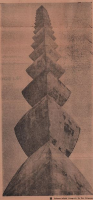
■ Sculptura abstractă „Șerpărie” de Constantin Brâncuși

■ În țara noastră, în zilele noastre, se construiesc multe case noi. Aceste case sunt foarte frumoase și foarte confortabile. Sunt case care au toate facilitățile necesare pentru o viață bună. Sunt case care au toate facilitățile necesare pentru o viață bună.